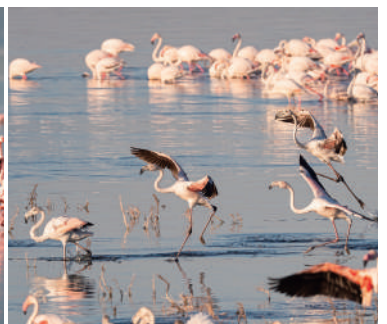
肯尼亞山國家公園或阿布岱爾國家公園