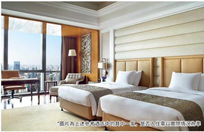
*圖片為上述參考酒店中的其中一家，是否入住需以實際情況為準