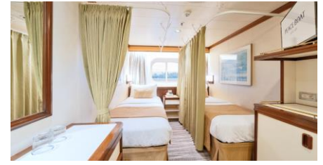
同行共享海景艙房

Size 面積：14 m 2 (II - Plus II) / 16 m 2 (Plus I) Deck 樓層：5-6 (II), 8 (I), 8 (Plus II), 9-11 (Plus I)