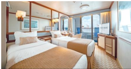
露台艙房 Balcony Cabin

Size 面積：17 m 2 Including Balcony 連露台 Deck 樓層：9 (II), 10-12 (I)