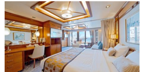
Premium Suite 豪華套房

Size 面積：37 m 2 Including Balcony 連露台 Deck 樓層：8