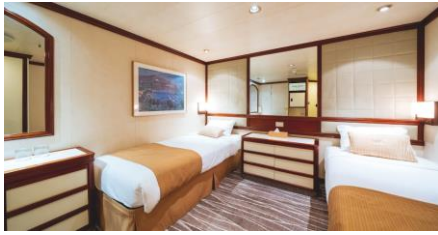
內艙房 Inside Cabin /