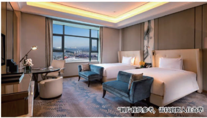
*圖片僅供參考，需以實際入住為準