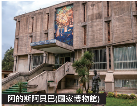
阿的斯阿貝巴(國家博物館)