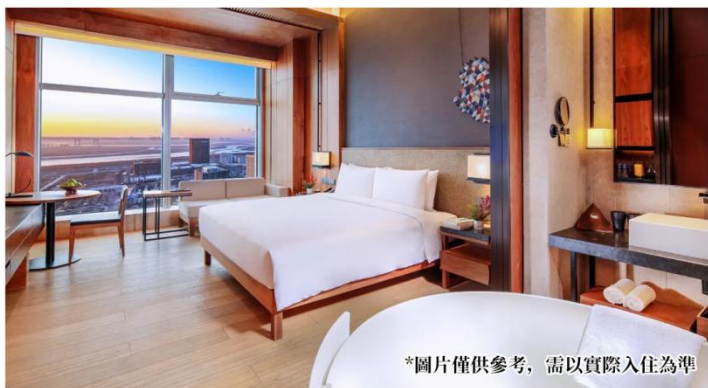
*圖片僅供參考，需以實際入住為準