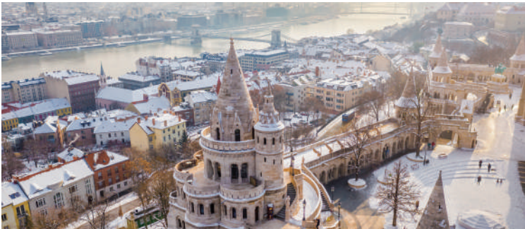
布達佩斯 遊覽布達城的漁夫城堡和馬提亞教堂，旁邊建有白色尖塔和彩色馬賽克磁磚屋頂，於門外拍照後，途經皇宮廣場，從高處俯瞰布達佩斯全景。