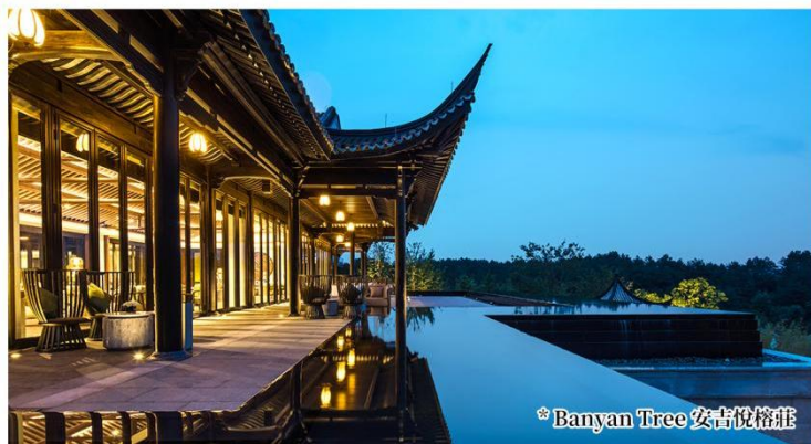
*Banyan Tree 安吉悅榕莊