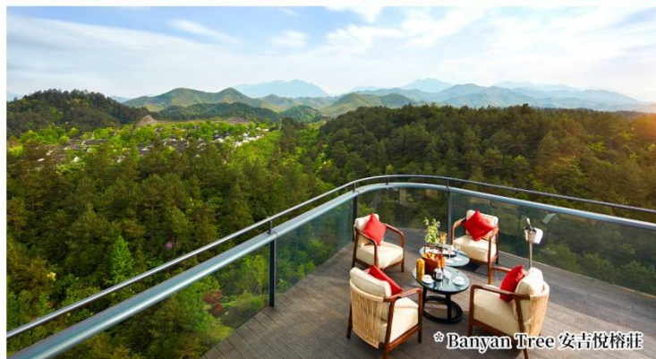
*Banyan Tree 安吉悅榕莊