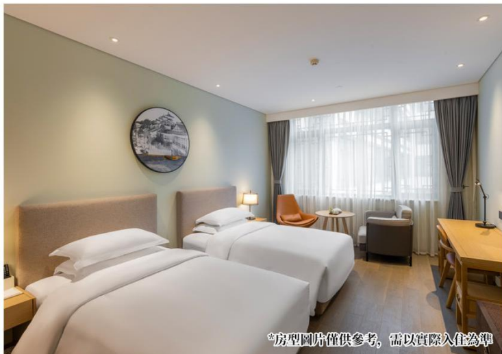
*房型圖片僅供參考，需以實際入住為準