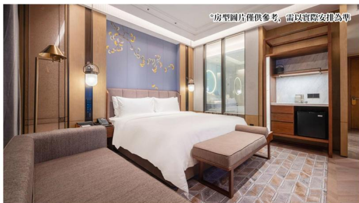
*房型圖片僅供參考，需以實際安排為準