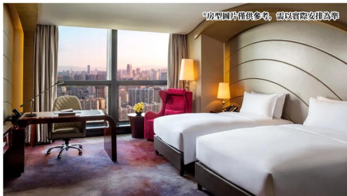
*房型圖片僅供參考，需以實際安排為準