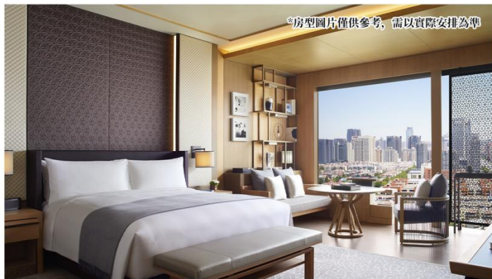
*房型圖片僅供參考，需以實際安排為準