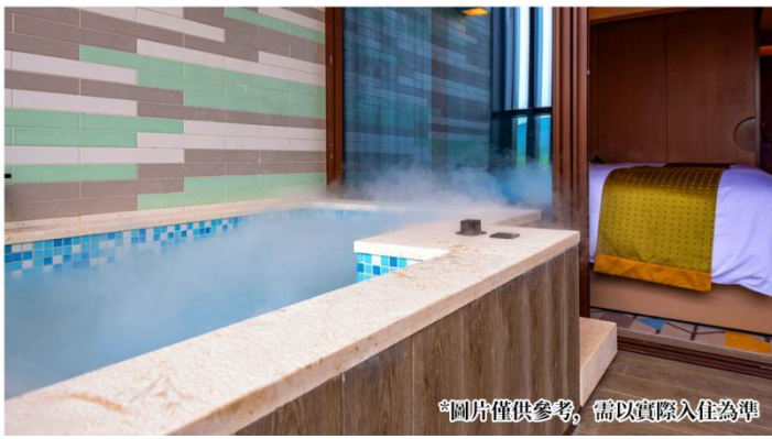
*圖片僅供參考，需以實際入住為準