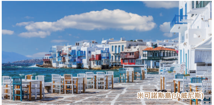
米可諾斯島(小威尼斯)