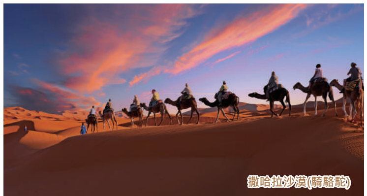
撒哈拉沙漠(騎駱駝)