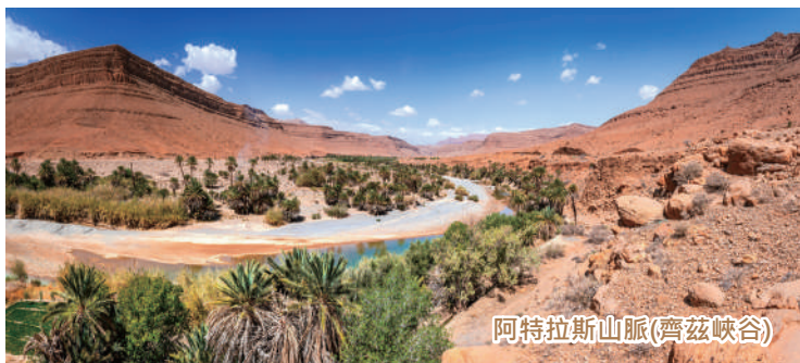
阿特拉斯山脈(齊茲峽谷)

🏠 住宿：KASBAH XALUCA 或 CHERGUI 或同級酒店 🍽️ 早：酒店 | 午：當地餐廳 | 晚：酒店