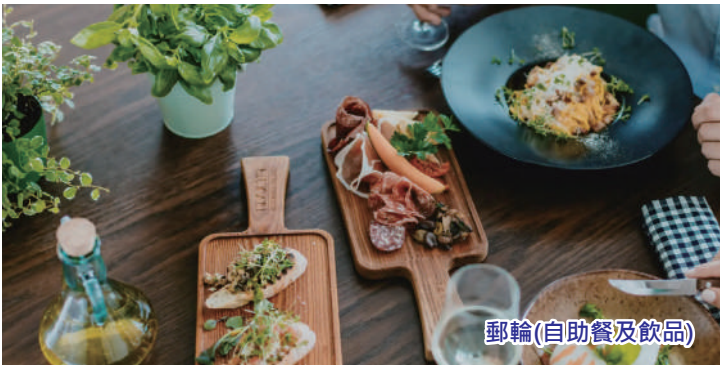
郵輪(自助餐及飲品)