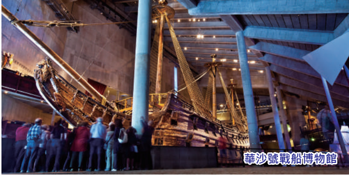
華沙號戰船博物館