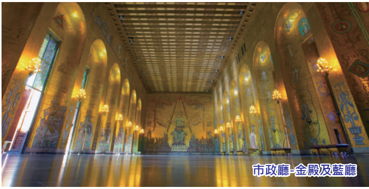
市政廳-金殿及藍廳