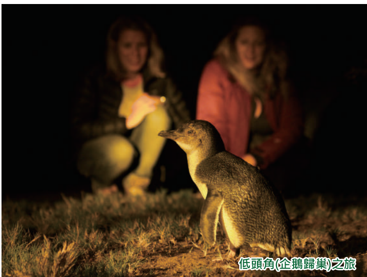
低頭角(企鵝歸巢)之旅