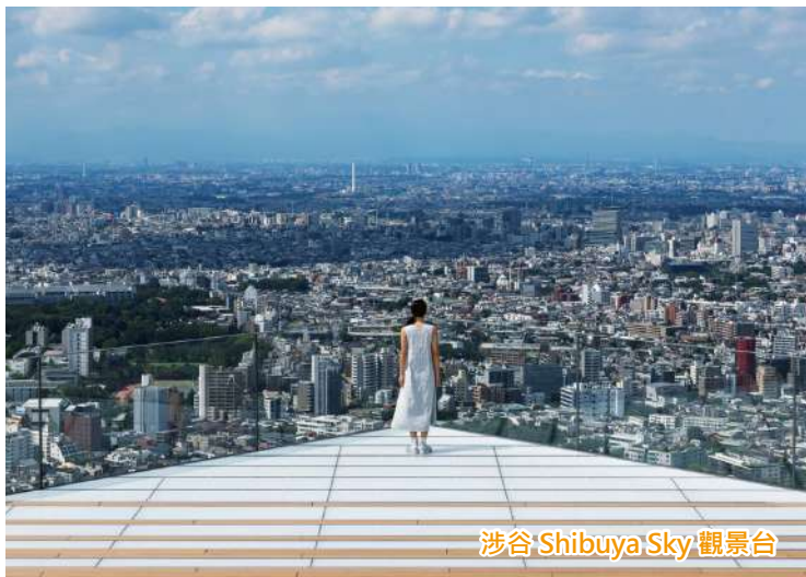
涉谷 Shibuya Sky 觀景台