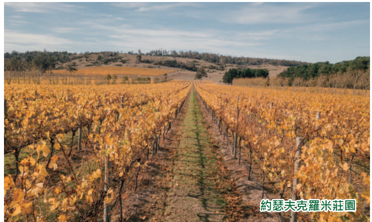
約瑟夫克羅米莊園

是日晚上由「翠明假期」領隊陪同下，乘坐澳洲航空公司客機經澳洲東岸城市轉機後飛往塔斯曼尼亞北部～朗塞斯頓。