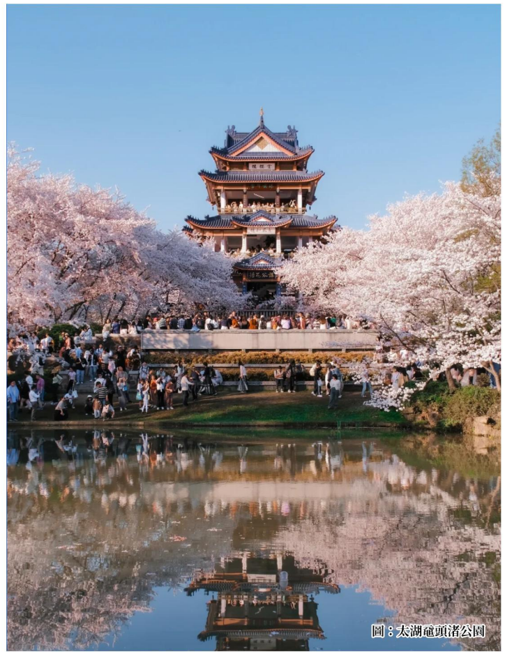
圖：太湖電頭渚公園