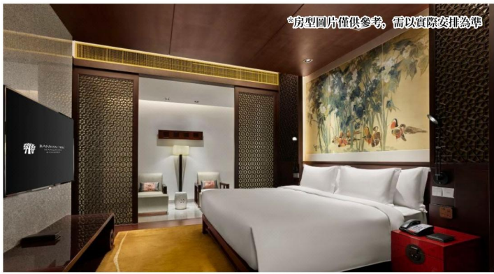
*房型圖片僅供參考，需以實際安排為準