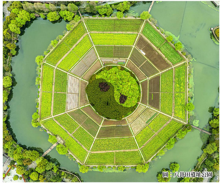
圖：八卦田遺址公園