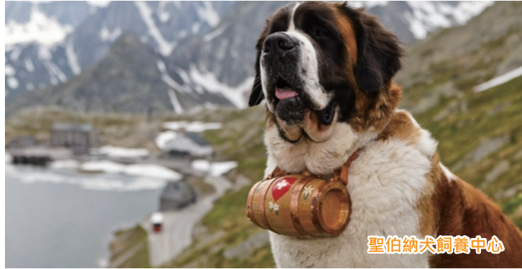
聖伯納犬飼養中心