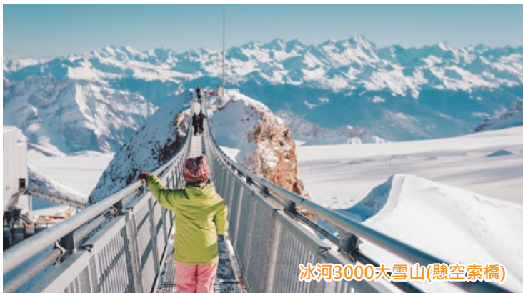
冰河3000大雪山(懸空索橋)