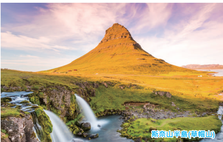
斯奈山半島(草帽山)