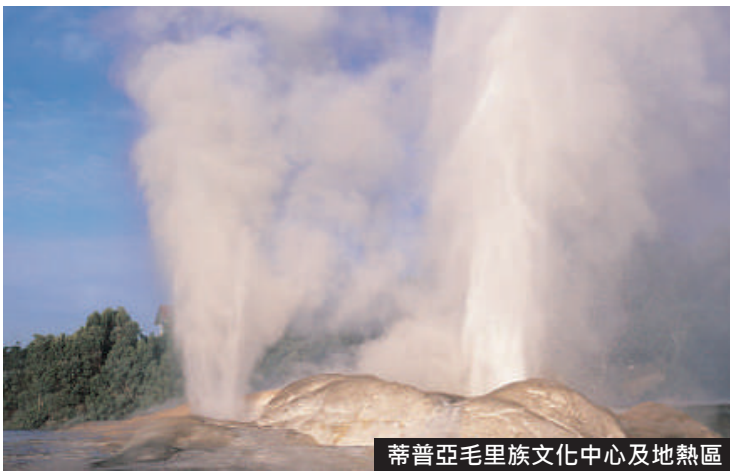
蒂普亞毛里族文化中心及地熱區

🍽️ 早：酒店 | 午：當地餐廳 | 晚：Harbourside Ocean Bar Grill ( 特色海鮮餐 )