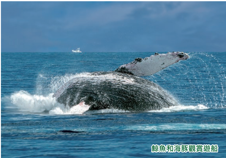
鯨魚和海豚觀賞遊船