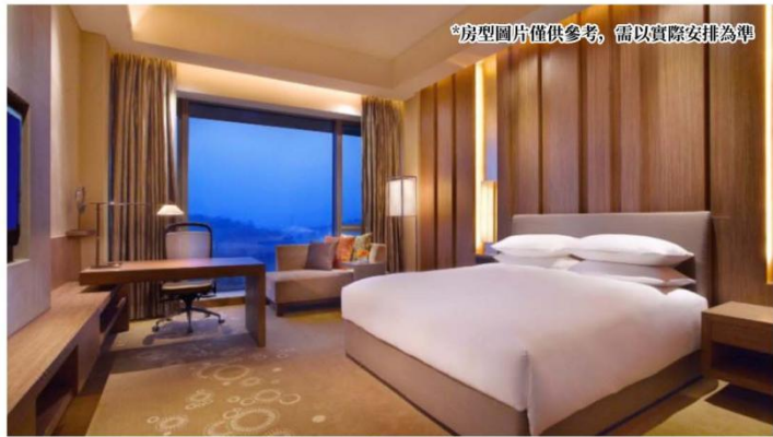
*房型圖片僅供參考，需以實際安排為準