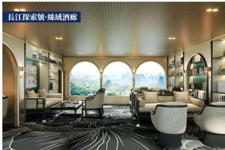
長江探索號·絲絨酒廊