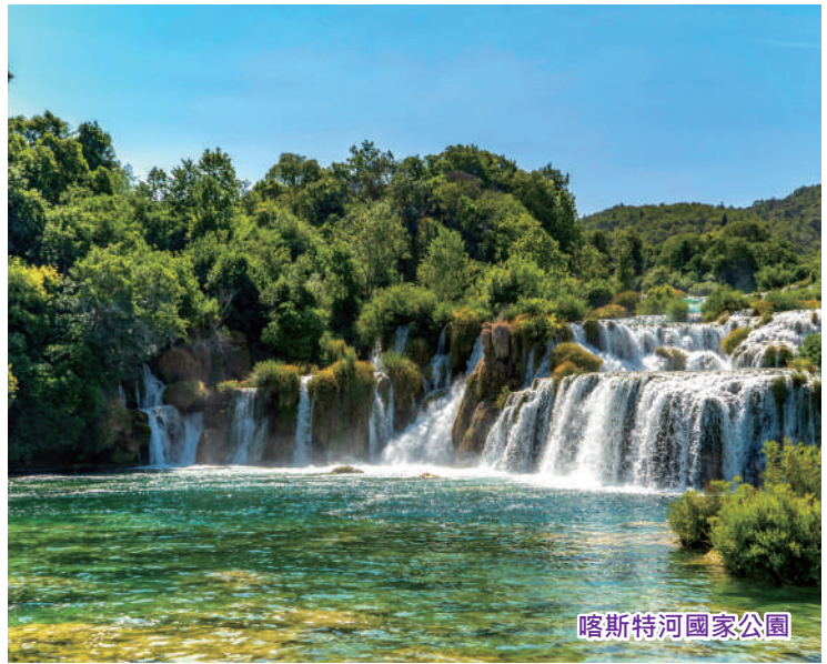
喀斯特河國家公園