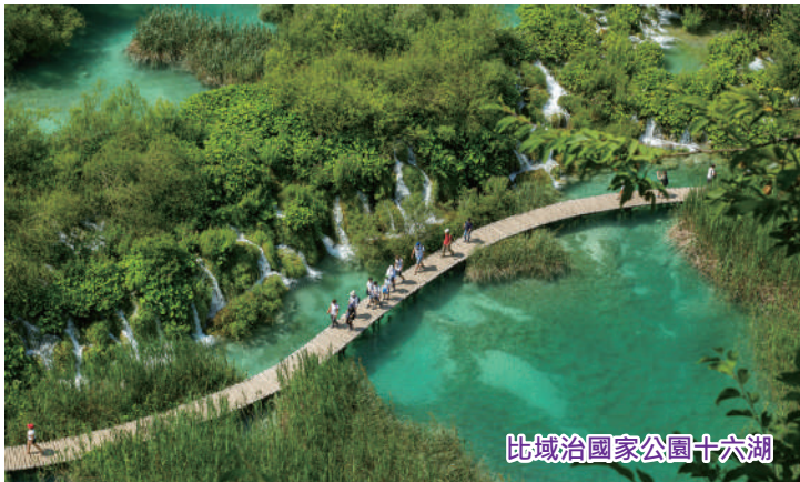
比域治國家公園十六湖

注意：比域治國家公園為季節性開放觀光路線節目，故由每年12月尾至翌年4月初，因冬季經常降雪或受天氣影響，將有可能改變或縮減觀光路線。另外，團友請自備行山杖及行山防滑鞋，敬請留意。