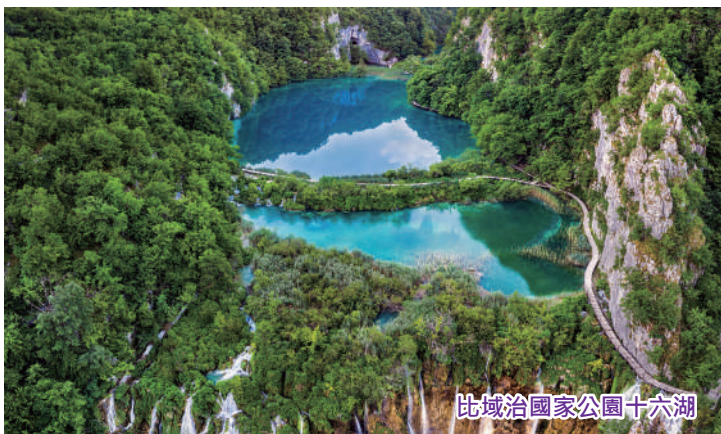
比域治國家公園十六湖