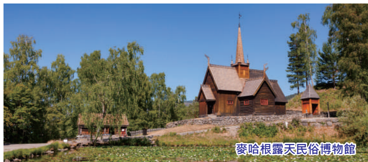
麥哈根露天民俗博物館

住宿：HAVILA HOTEL GEIRANGER或同級酒店 早：酒店 | 午：山頂HOVEN餐廳及飲品一杯 | 晚：酒店