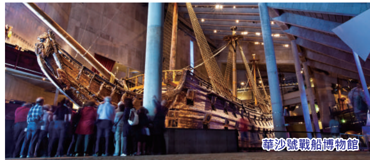
華沙號戰船博物館