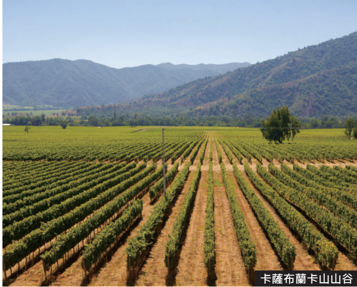
卡薩布蘭卡山山谷