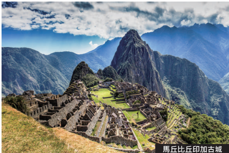
馬丘比丘印加古城