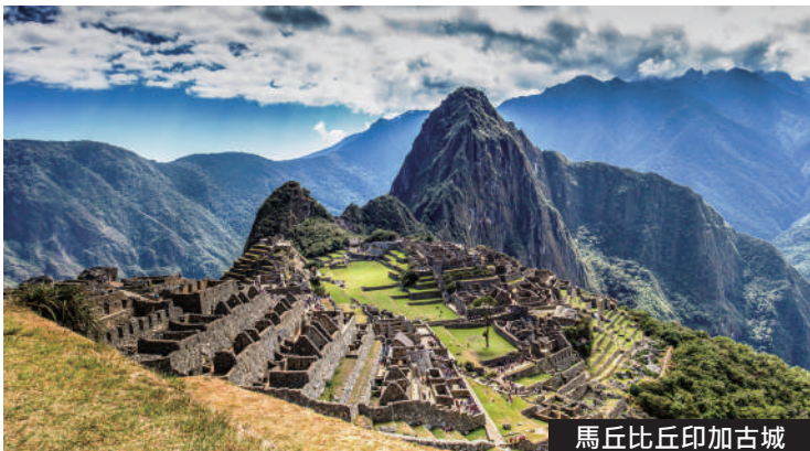
馬丘比丘印加古城