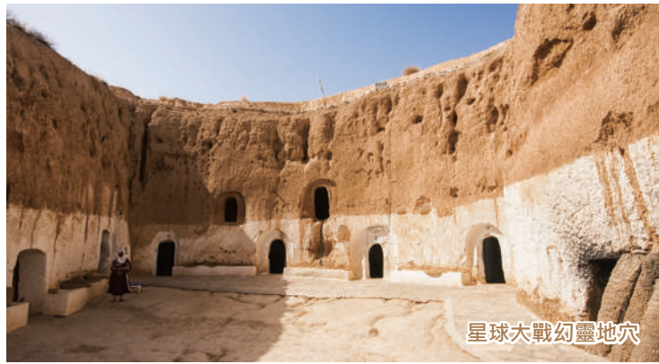
星球大戰幻靈地穴