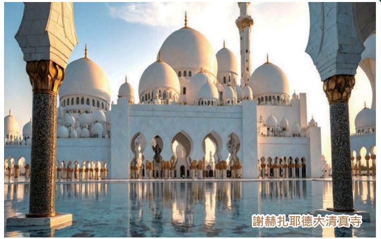
謝赫扎耶德大清真寺