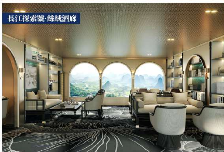
長江探索號·絲絨酒廊