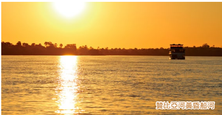
贊比亞河黃昏船河