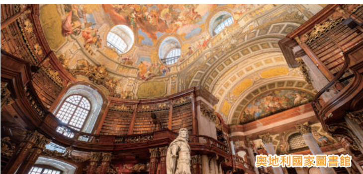
奧地利國家圖書館