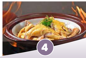
英迪格酒店·瀘沽湖風味