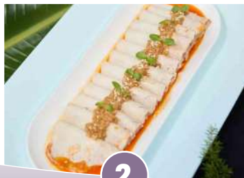
希爾頓酒店·大理風味