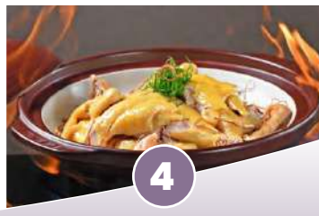
英迪格酒店·瀘沽湖風味