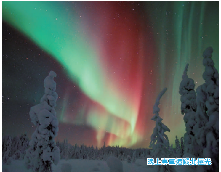
晚上專車追蹤北極光