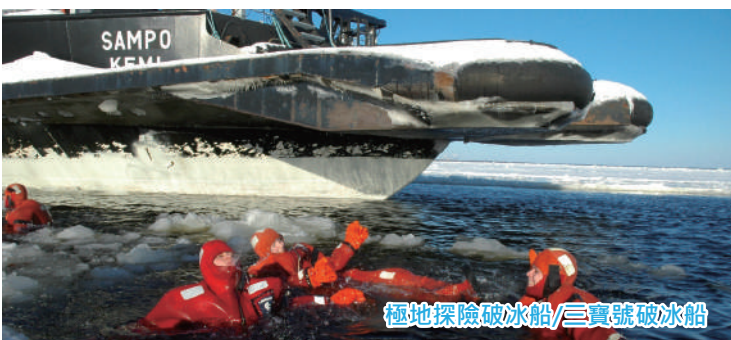
極地探險破冰船/三寶號破冰船