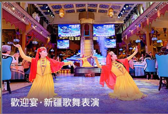
歡迎宴·新疆歌舞表演