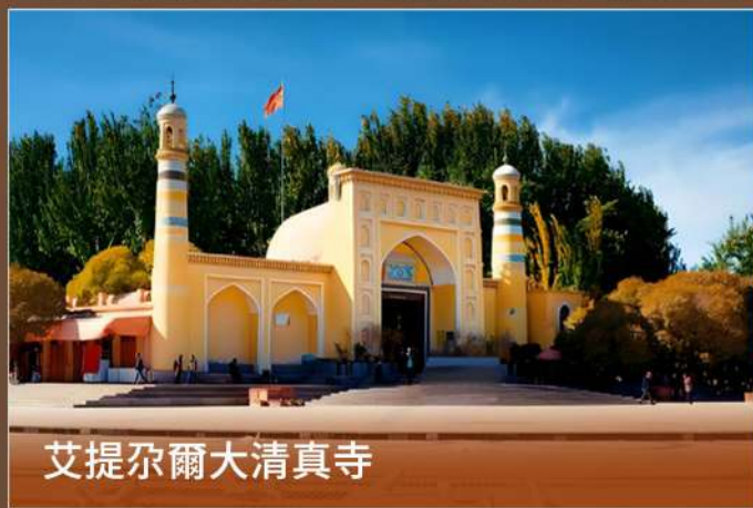
艾提尕爾大清真寺