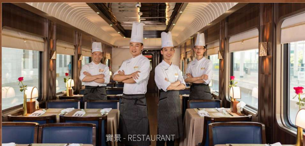
實景 - RESTAURANT

廚師團隊由深耕高端餐飲領域20余年的明星主廚領銜， 匯聚來自知名烹飪學府與地域美食專家的優秀成員，為您打造以粵菜、 新川菜為主的高品質美味...盡享美食美景愜意旅途時光