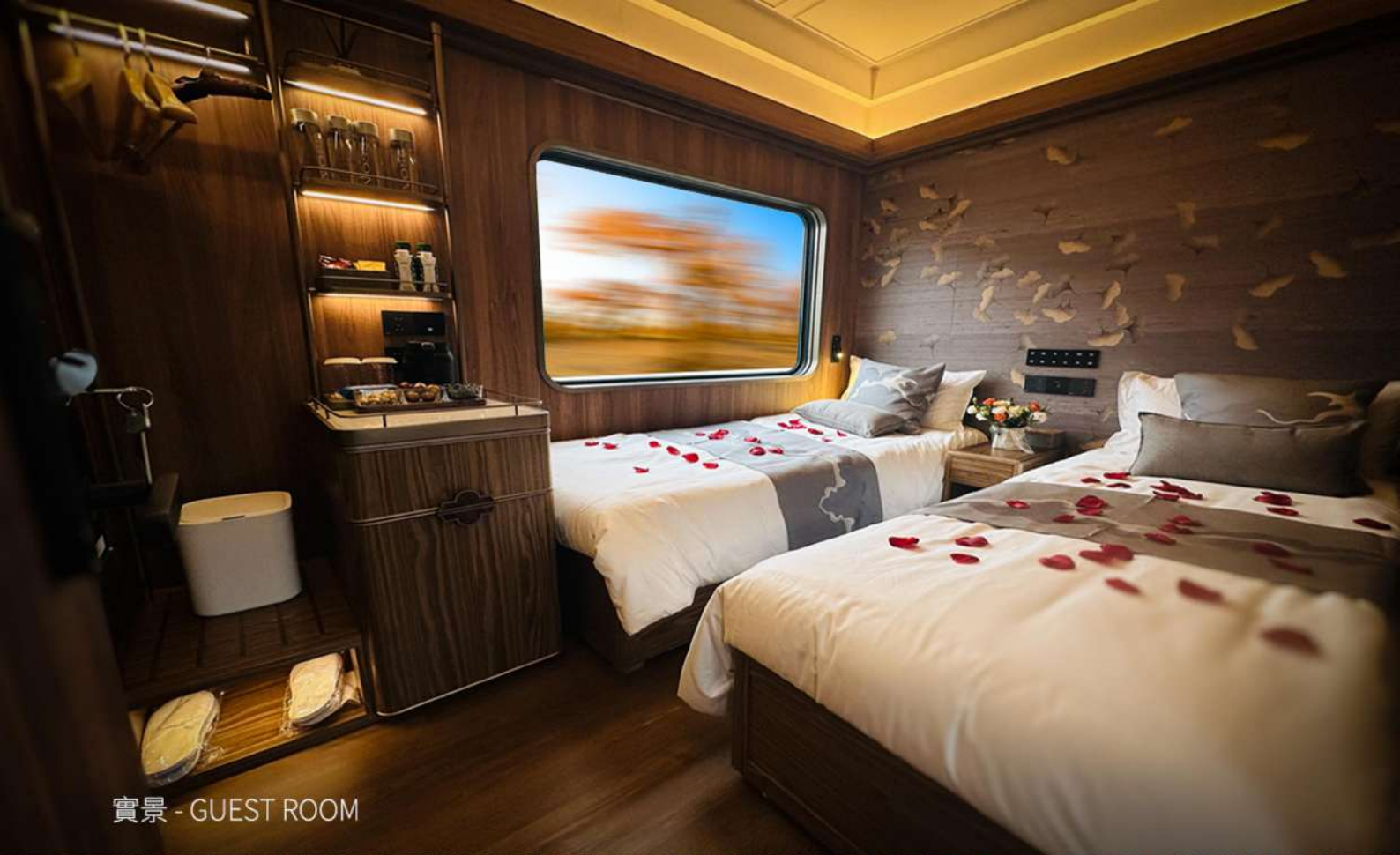
實景 - GUEST ROOM