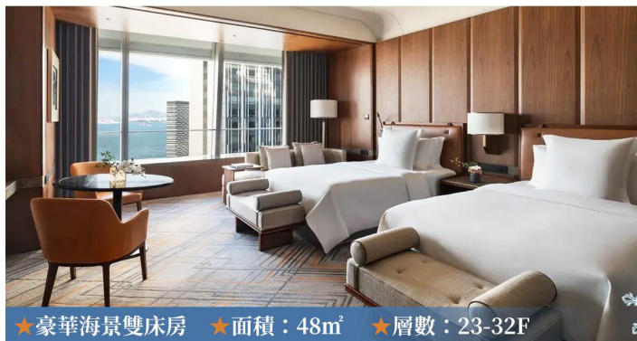
★豪華海景雙床房 ★面積：48m 2 ★層數：23-32F

大連四季酒店位於中國北方美麗的海濱城市大連，座落於東港CBD核心區域。酒店擁有雅緻客房和套房，位於23-36層，盡攬繁華城市景色和壯麗海景。全落地窗無邊泳池，可盡攬大連城市美景。