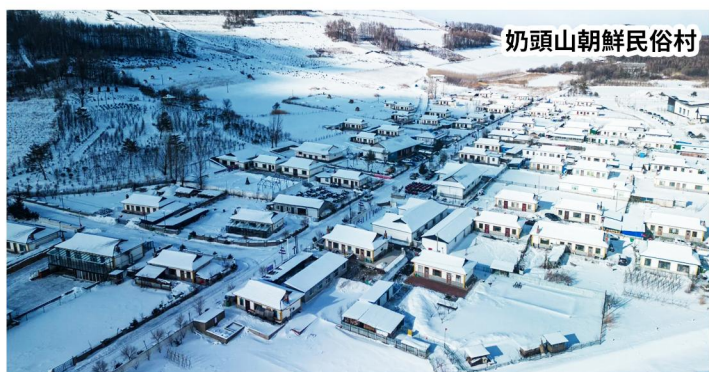
奶頭山朝鮮民俗村