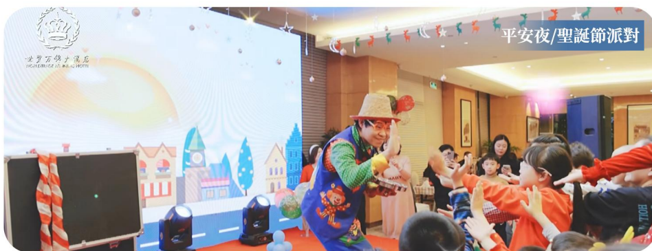
平安夜/聖誕節派對