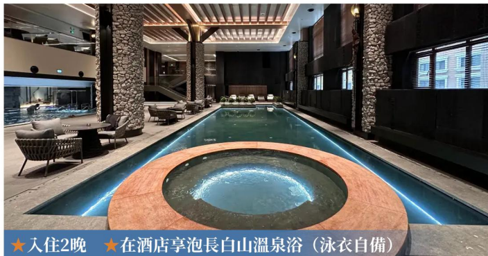
★入住2晚 ★在酒店享泡長白山溫泉浴（泳衣自備）

酒店座落在長白山保護開發區北景區長白山大街，樓高7層，分為A、B、C座。溫泉部設有室內外湯池，據有治療功能的桑拿房、兒童戲水區、風味小吃等功能，是旅遊度假、休閒度假的選擇之處。