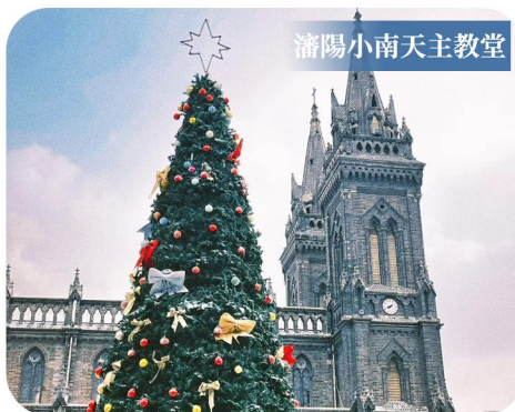
瀋陽小南天主教堂