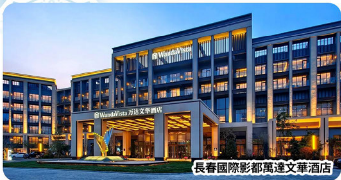
長春國際影都萬達文華酒店