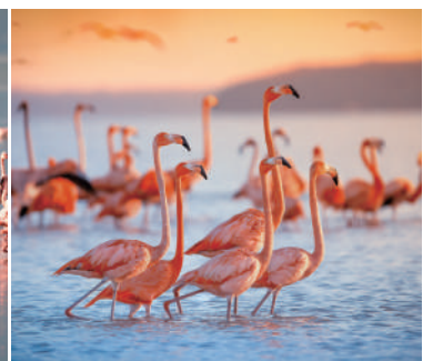
肯尼亞山國家公園或阿布岱爾國家公園