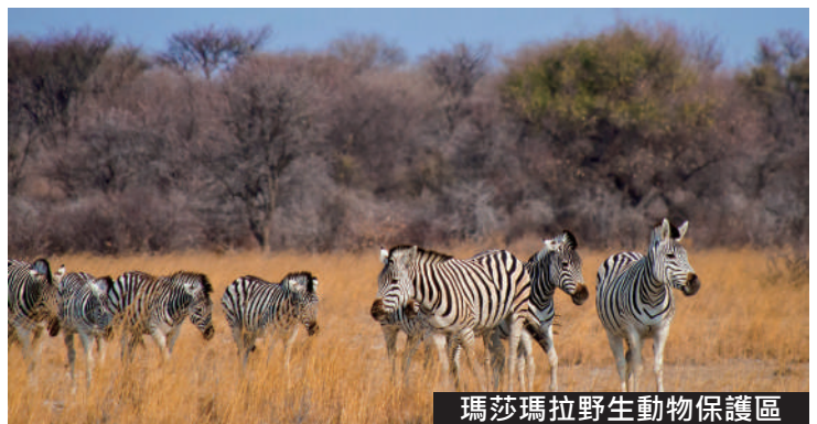
瑪莎瑪拉野生動物保護區

注意：瑪莎瑪拉屬自然環境生態地區，電力供應不穩定，酒店會有短暫停電及水壓不足等情況！