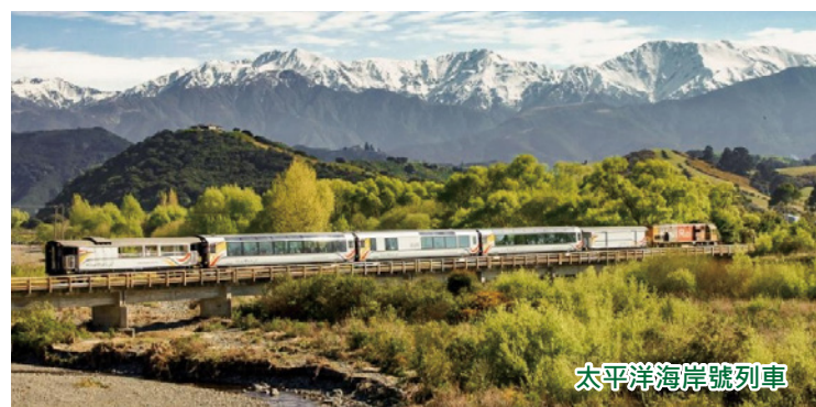
太平洋海岸號列車