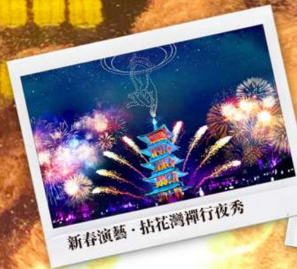
新春演藝·拈花灣禪行夜秀