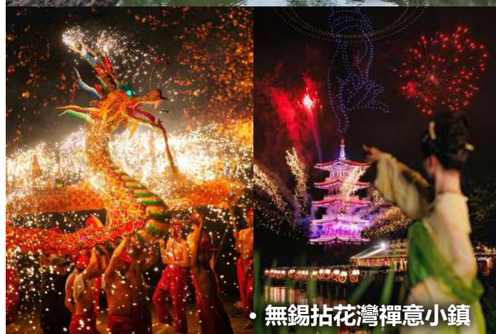
• 無錫拈花灣禪意小鎮