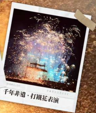
千年非遺·打鐵花表演