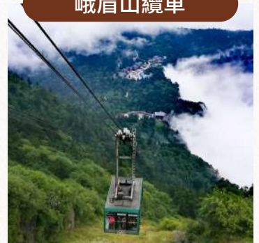
高空飛渡，直上金頂之巔