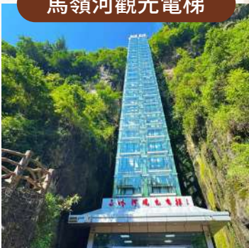
全國第二高室外觀光電梯