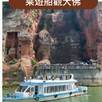
乘遊船遠觀大佛，避開擁堵