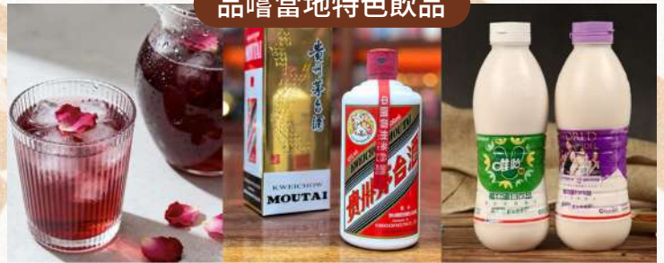
雲南玫瑰醋、貴州茅臺酒、四川唯怡豆奶