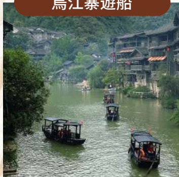
穿梭烏江山水，盡覽十里畫廊