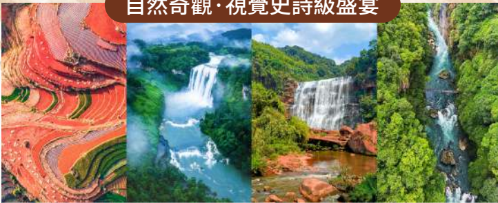
東川紅土地、黃果樹瀑布群、赤水丹霞、馬嶺河峽谷