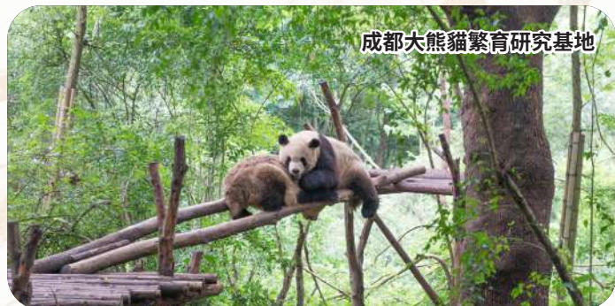
成都大熊貓繁育研究基地