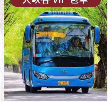
雅魯藏布大峽谷 VIP 包車