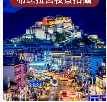
聖域不夜, 金頂長明