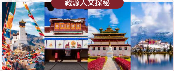
深度解鎖「藏源」歷史!