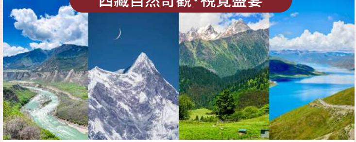
雅魯藏布大峽谷、遠眺南迦巴瓦峰、魯朗林海、羊卓雍措