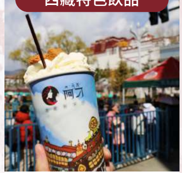
拉薩本土奶茶——阿刁奶茶