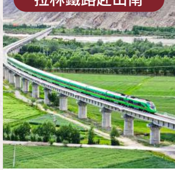
免乘 8 小時長途車程, 旅途更舒適!