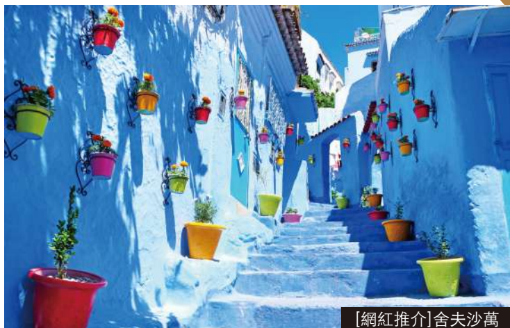
[網紅推介]舍夫沙萬

是日晚上於香港國際機場集合，由翠明假期領隊陪同下，乘坐中東航空公司客機經中東城市轉機後飛往摩洛哥城市~卡薩布蘭加。