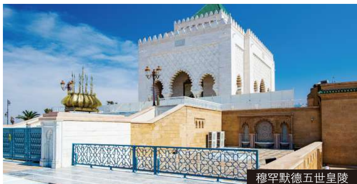
穆罕默德五世皇陵