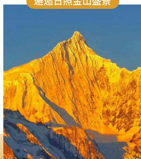
入住景觀房 屋內欣賞日照金山美景