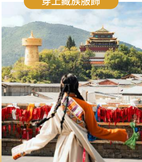
在獨克宗古城定格絕美瞬間