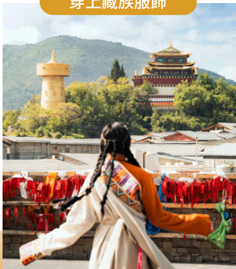
在獨克宗古城定格絕美瞬間