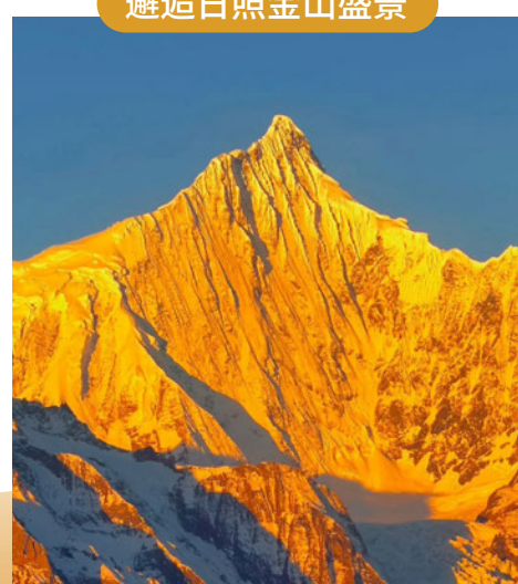
入住景觀房 屋內欣賞日照金山美景