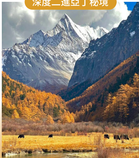
開啟一場震撼靈魂的 夢幻征途