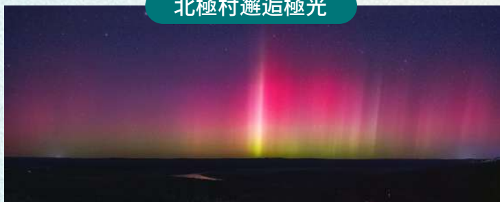
打卡北極村全系列「最北」地標，邂逅極光奇觀