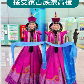
哈達接機 + 太陽花禮盒