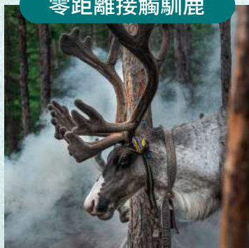
敖魯古雅使鹿部落馴鹿互動