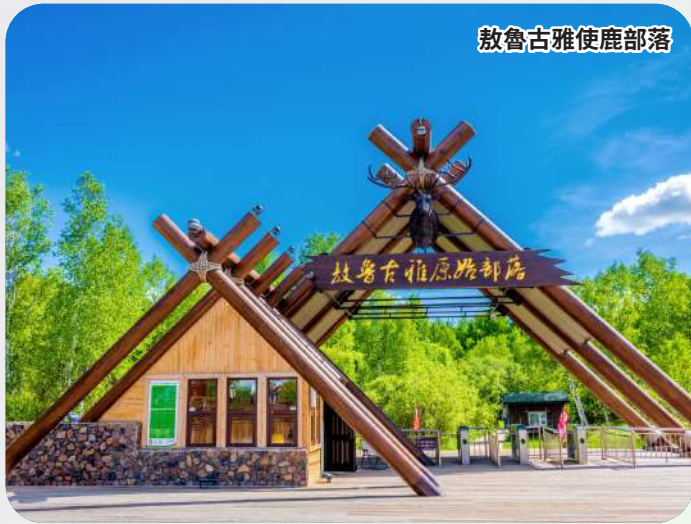
敖魯古雅使鹿部落