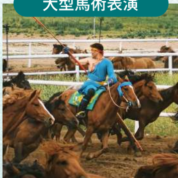
觀看「馬之舞」大型馬術表演