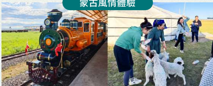
草原小火車體驗 & 牧民家訪深度互動