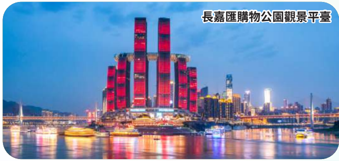
長嘉匯購物公園觀景平臺